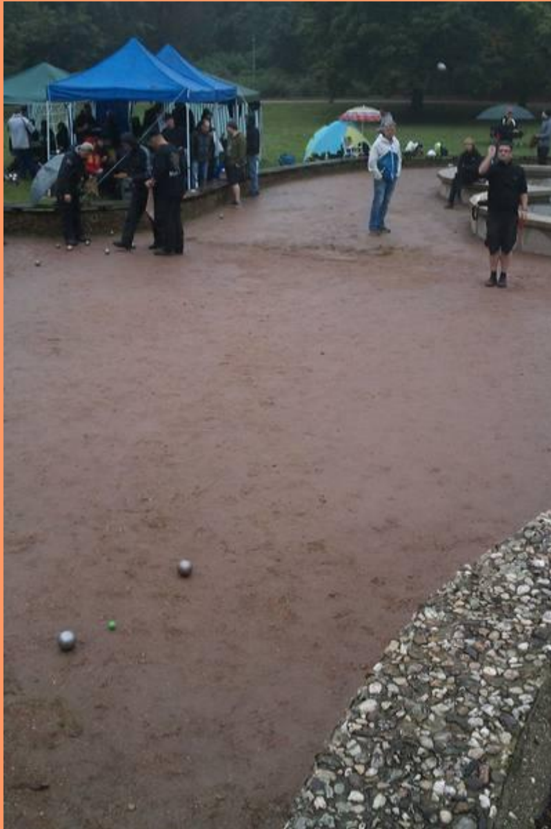
Tiefer Boden: Veikko Dähne (Halle) konzentriert sich auf den Abwurf