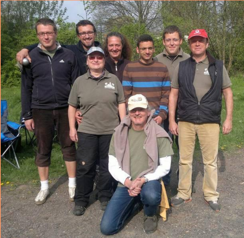
Auch hier schon auf Siegeskurs: Die Chemnitzer Erfolgstruppe in ihren (noch) olivgrünen Trikots