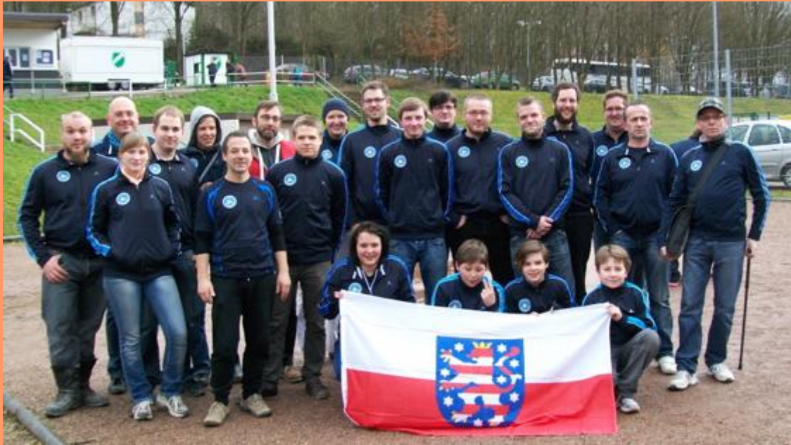
Das gesamte PV Ost-Team