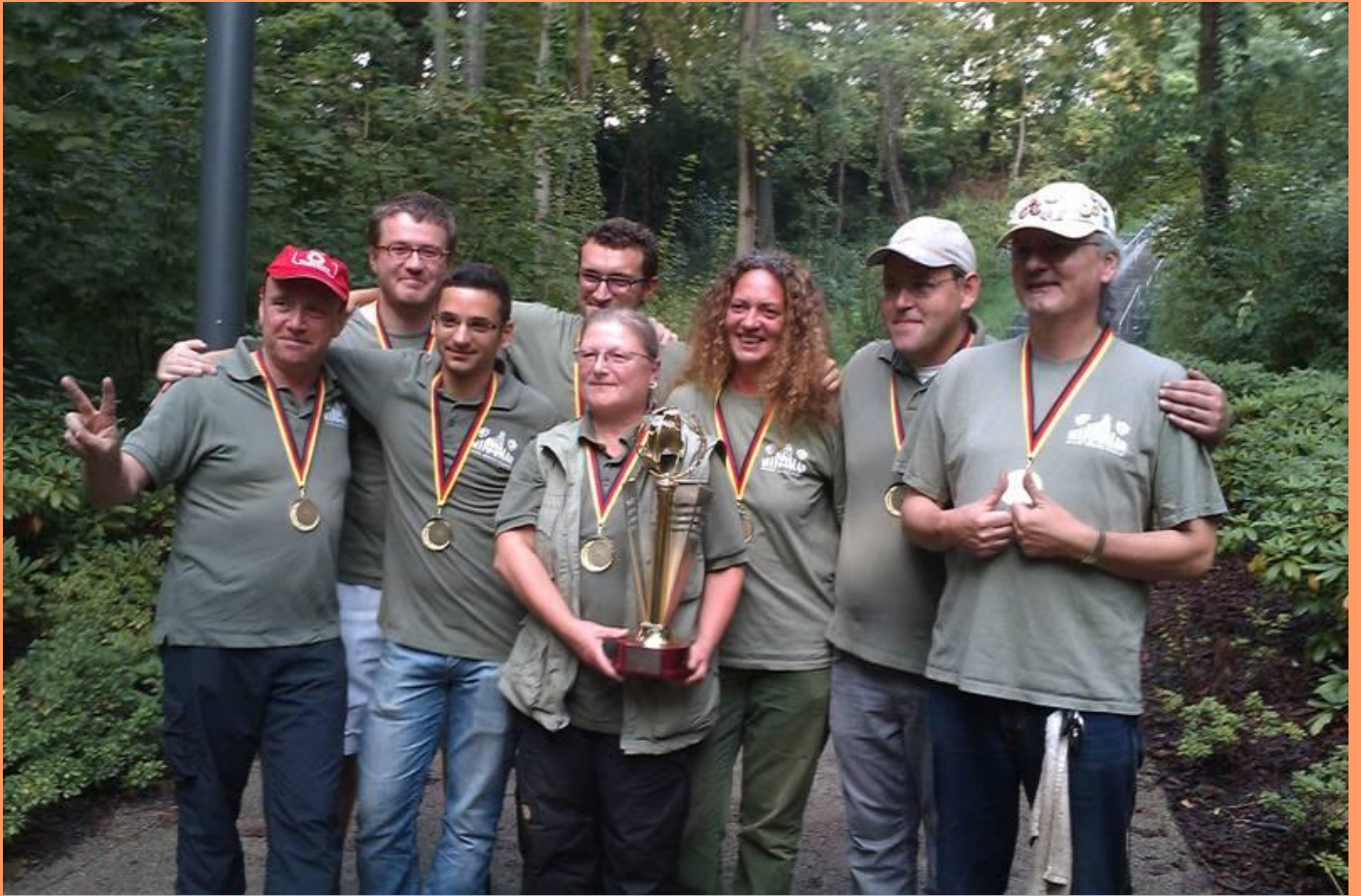
Das Erfolgsteam Oliv