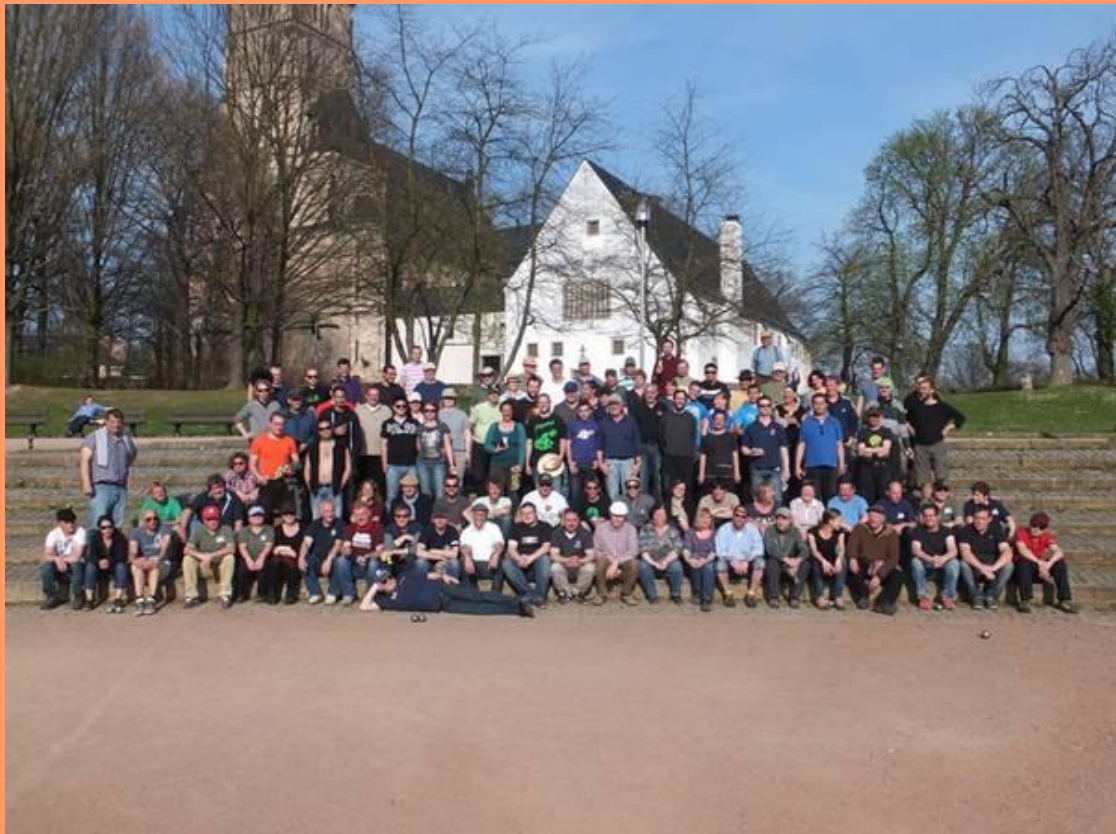
Seltenheit im PV Ost-Land: Ein 102köpfiges Teilnehmerfeld!