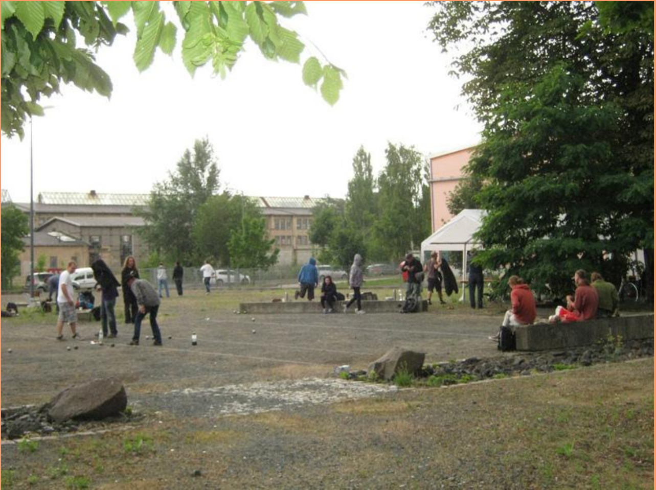
Coppa ohne Canaletto-Blick: Austragungsort ist diesmal eine kurzfristig zur Boule-Arena umfunktionierte Industriebrache in Dresdens Osten