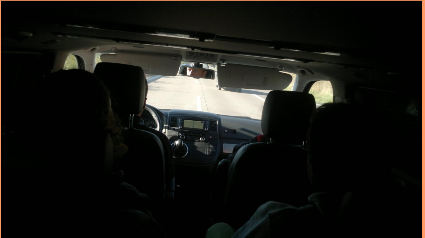
Vorstoß in noch unbekanntes Terrain: Hartmut Lohß am Steuerpult der Chemnitzer Expeditionscrew