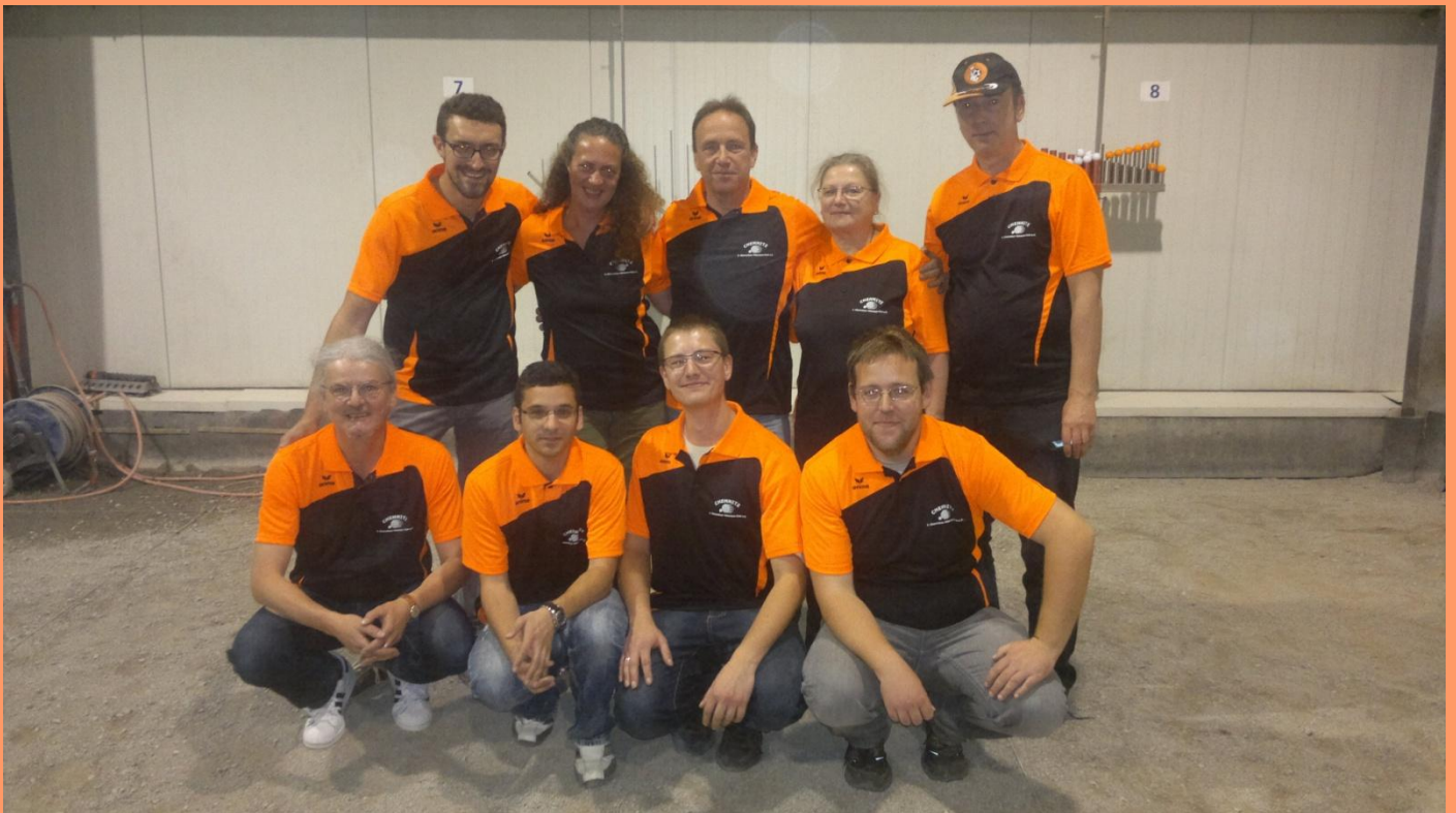
Leuchtende Augen und leuchtend neue Trikots: Die Chemnitzer vor dem Start

Überragender Auftakt: Favorit Wiesbaden wird mit 4:1 deklassiert! Die entscheidenden Würfe: